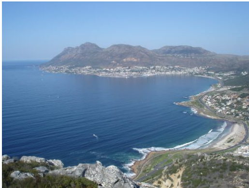
Aussicht vom Elsie's Peak auf Simon's Town