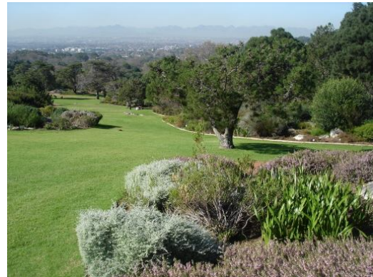
Kirstenbosch Botanischer Garten