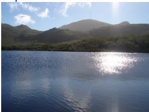
Damm im Silvermine Nature Reserve