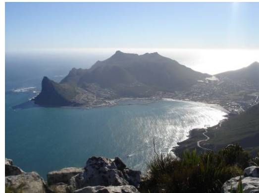
Vom Nordhoek Peak auf Hout Bay